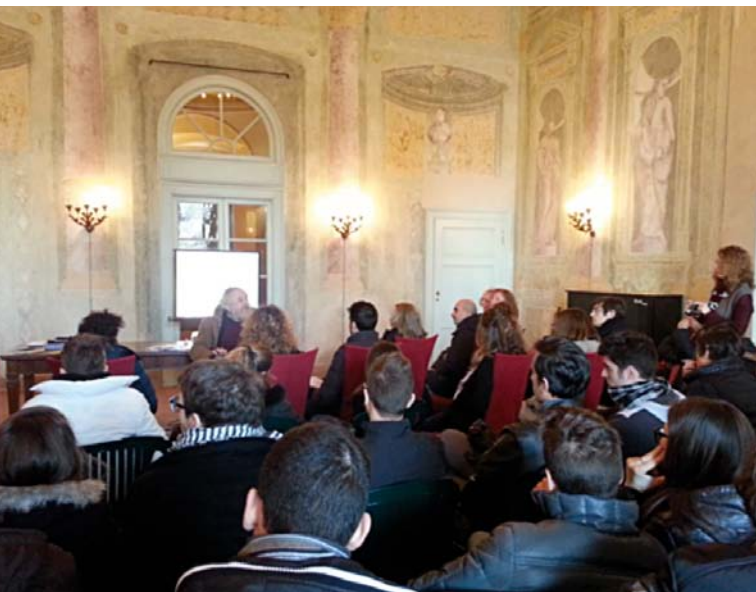
Guido Oldani Seconda Lectio Poe-Magistralis

Una serie di incontri con gli autori in Villa Mirabello, nel parco di Monza. A partire dal mese di aprile, fino ad ottobre, alcuni scrittori e poeti racconteranno le loro opere e si confronteranno con il pubblico presente. È un modo per creare un legame con il territorio costruendo un dialogo tra un luogo che è stato deputato alle lettere e chi desidera vivere l'esperienza della scrittura e della poesia. Gli appuntamenti saranno ad ingresso libero e avranno luogo nel prestigioso salone affrescato della Villa Mirabello, nel cuore del Parco di Monza, dove nasce la Casa della Poesia di Monza.